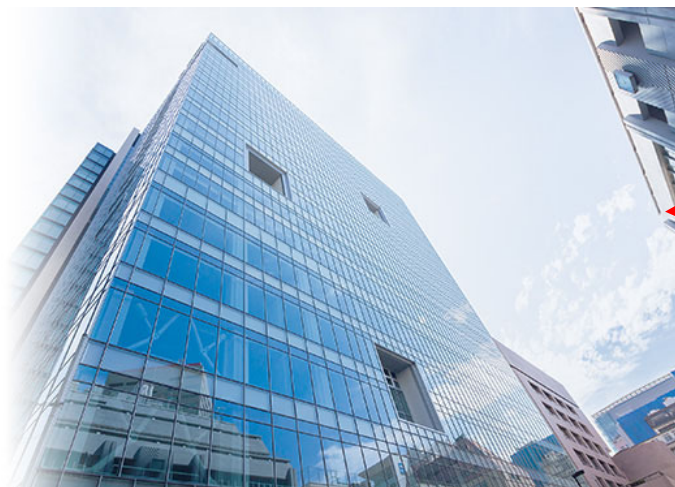
タワースコラ 1階 S101教室